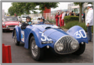
La Virée des Cols Vosgiens 2007 La Leblond 1947 au départ de Rosheim

2 RALLYES 2008 + 3 RALLYES 2009 = 5 CLASSIQUES