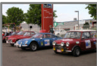
Virée des Cols Vosgiens 2008