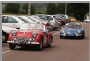
Routes du Jura 2007