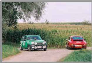
Ronde Vignes & Houblon 2007 Qui est sur le bon chemin ?