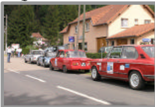
Virée des Cols Vosgiens 2006 Départ de l'Etape II à Abreschviller