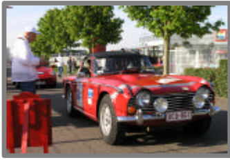
Rosheim, le 3 mai 2008