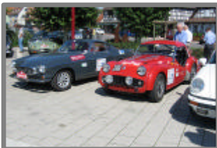
Ronde Vignes & Houblon 2006